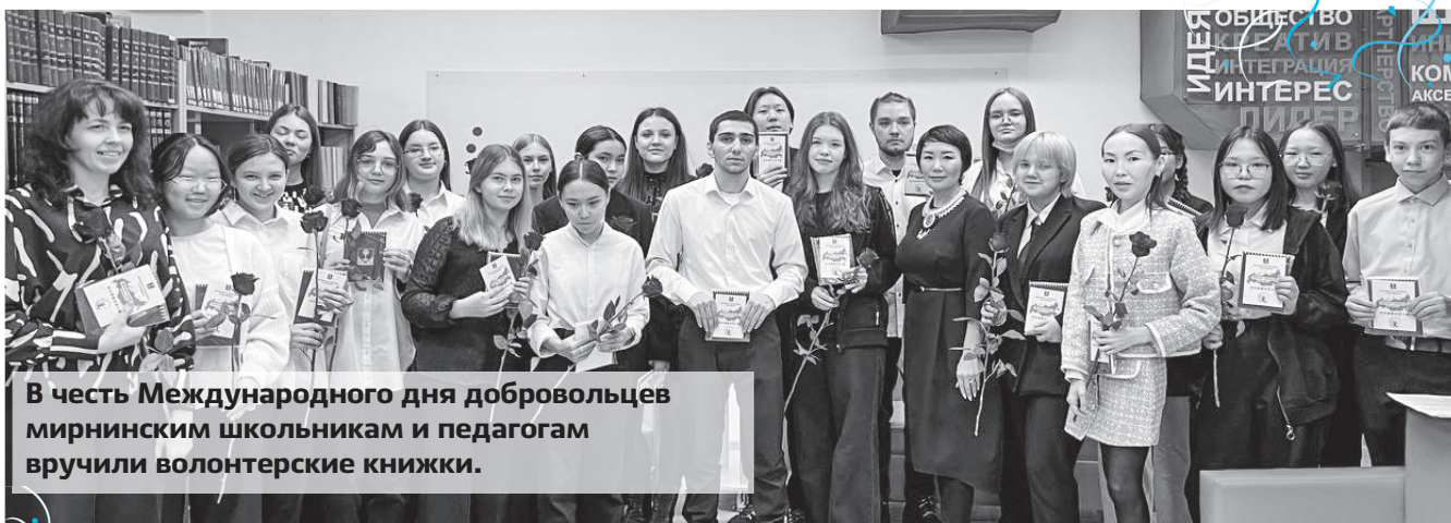
В честь Международного дня добровольцев мирнинским школьникам и педагогам вручили волонтерские книжки.